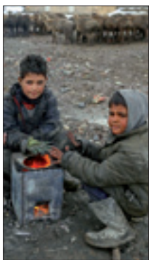
Bambini afgani sfollati vicino a Kabul

NEW YORK, 7. Più di sei bambini su dieci a livello mondiale non hanno accesso alla rete di protezione sociale, fatto che li espone al rischio di una povertà cronica. La denuncia è stata lanciata dall'Organizzazione internazionale del lavoro (Ilo) e dall'Unicef. Secondo i dati, sebbene esista una rete di sicurezza sociale per il 35 per cento dei giovani, questa cifra scende al 28 in Asia e al 16 in Africa. Inoltre, i 139 paesi analizzati nel dossier in media spendono l'1,1 per cento della loro ricchezza per i bambini fino ai 14 anni. «C'è un'enorme scarsità di investimenti che deve essere coperta», ha detto Isabel Ortiz, direttore del dipartimento di protezione sociale dell'Ilo. «I numeri peggiorano in alcune regioni», ha aggiunto, sottolineando che in Africa, «i bambini rappresentano il 40 per cento della popolazione, ma solo lo 0,6 viene effettivamente investito nella protezione sociale per i minori».