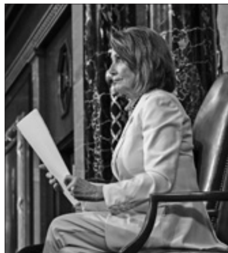
La speaker della Camera Nancy Pelosi