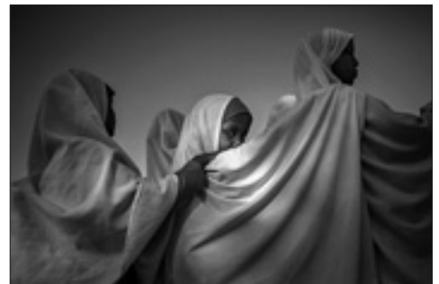
Somalia, Bosaaso, 2015

In questo tour nell'Africa dolente, il fotoreporter ci fa vedere poveri villaggi invasi dal fango, strade polverose solcate da mezzi militari, precari presidi sanitari, ricoveri improvvisati. Soprattutto ci mostra uomini donne che lottano ogni giorno per sopravvivere, che si tratti di duro lavoro o di sfuggire a un attacco, a una rappresaglia o di resistere in un campo profughi grande quanto una città. Ci presenta persone segnate da discriminazioni legate ad ataviche lotte etniche o ad antiche credenze. Ci pone dinanzi a vittime e ad aguzzini. Ci testimonia altresì l'inescu-