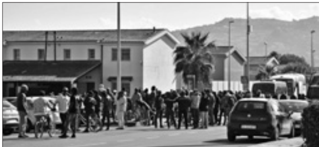
Migranti in attesa di essere trasferiti dal Cara di Minceo

sociali per l'integrazione e riabilitazione dei rifugiati». Il commissario osserva che «ridurre l'uso di alcuni centri potrebbe essere un passo positivo, dato che la loro dimensione spesso non si è tradotta in buone condizioni d'accoglienza e integrazione» ma poi ammonisce che «gli sforzi per cambiare l'esistente sistema di accoglienza dovrebbero essere fatti prendendo in considerazione la necessità di garantire a tutti coloro che vi risiedono il diritto umano a un'adeguata accoglienza, alle cure e all'assistenza».