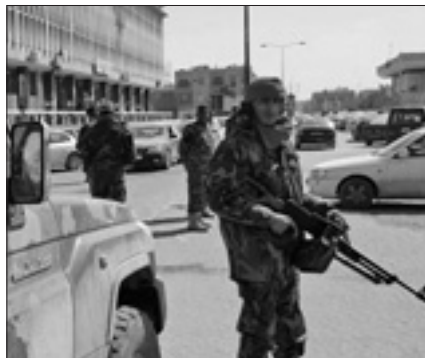
Forze fedeli a Khalifa Haftar pattugliano la città di Sebha nel sud della Libia