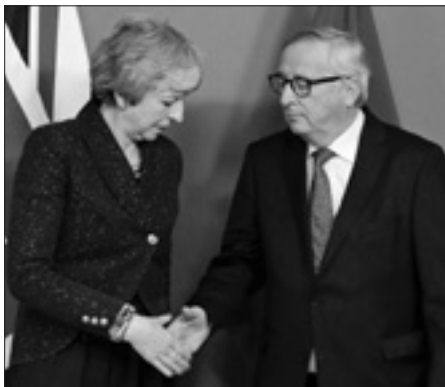
Theresa May a Bruxelles con il presidente della Commissione europea Jean-Claude Juncker

Da parte sua, May ha descritto il contesto nel Parlamento del Regno Unito e le motivazioni alla base del voto della scorsa settimana alla Camera dei Comuni in cerca di una