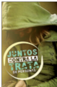
Adorando alla Giornata internazionale dell'8 febbraio, il Gruppo Santa Marta, voluto dal Papa per la lotta contro la tratta delle persone, si dà appuntamento alle 17.30 di Buenos Aires, nella cattedrale della capitale argentina, dove il cardinale presidente Vincent Nichols, celebra la messa nella memoria di santa Giuseppina Bakhita.